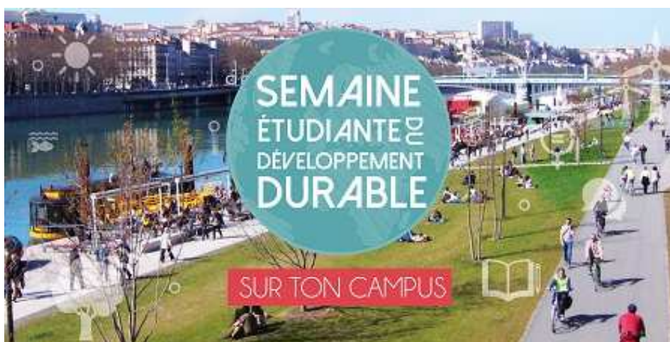
Semaine étudiante du développement durable du 1er au 7 avril 2019